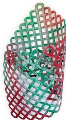
Daniel Dezeuze, Pavillon, 2001 peinture sur polyéthylène, 200 x 120 x 70 cm

Objet d'une publication de textes et de dessins de Daniel Dezeuze, L'art de la solitude* , les dessins de Rochers chinois présentés à la galerie AL/MA ont été inspirés par les formes tourmentées de pierres remarquables, creusées de multiples cavités après un séjour prolongé dans les eaux du lac Taï. Loin de la représentation, les dessins de Daniel Dezeuze s'affranchissent de toute servitude envers l'objet désigné comme « motif » et jouent des ambiguïtés de la mise à plat du dessin et des formes qu'il fait apparaître et que l'œil s'empresse de faire glisser vers des éléments de relief. A leur manière, les trois Pavillons (2002), questionnent aussi cette ambiguïté de la surface et du volume. La simplicité de la forme ne signifie pas la simplicité de l'expérience de perception. De multiples jeux se glissent de l'une à l'autre.